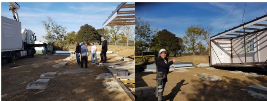
Arrivée du second élément avec Bernadette d'EMMAÛS à la manoeuvre!

Février: EMMAÛS TOULOUSE - LABARTHE sur LEZE - Montage du bungalow don d'ENEDIS à EMMAÛS destiné à la vente en ligne. Démontage sur le site des 7 Deniers de Toulouse, transport en quatre "morceaux", montage sur les plots réalisés gracieusement par une entreprise BTP partenaire de l'association.